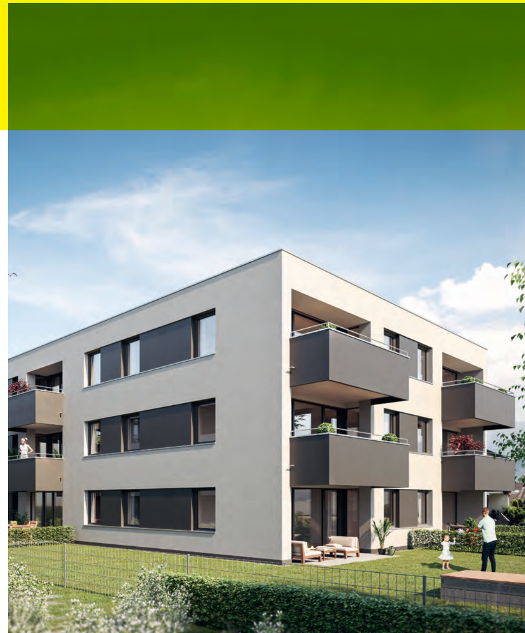
Zeitlos schön Elegant erscheint das helle Mehrfamilienhaus mit dunklen Fensterbändern und Brüstungen.

Eine klare Formensprache, die Brechung der hellen Fassade durch dunkle Fensterbänder, die in den Baukörper hineinragenden Terrassen und Balkone sowie die dezente Farbwahl machen dieses Wohnhaus modern und dennoch zeitlos schön. Die einzelnen Wohnungen sind nach Osten, Süden oder Westen ausgerichtet und kommen so unterschiedlichen Licht- und Sonnenbedürfnissen der künftigen Bewohner entgegen.